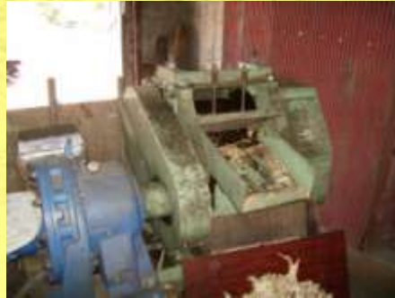
さとうきび压榨機