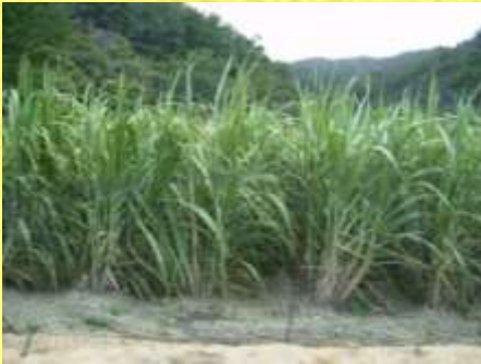
加計呂麻島さとうきび畑